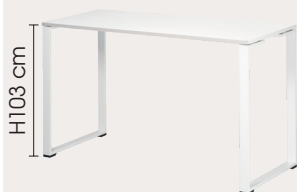
TABLE DE RÉUNION HAUTE THELMA