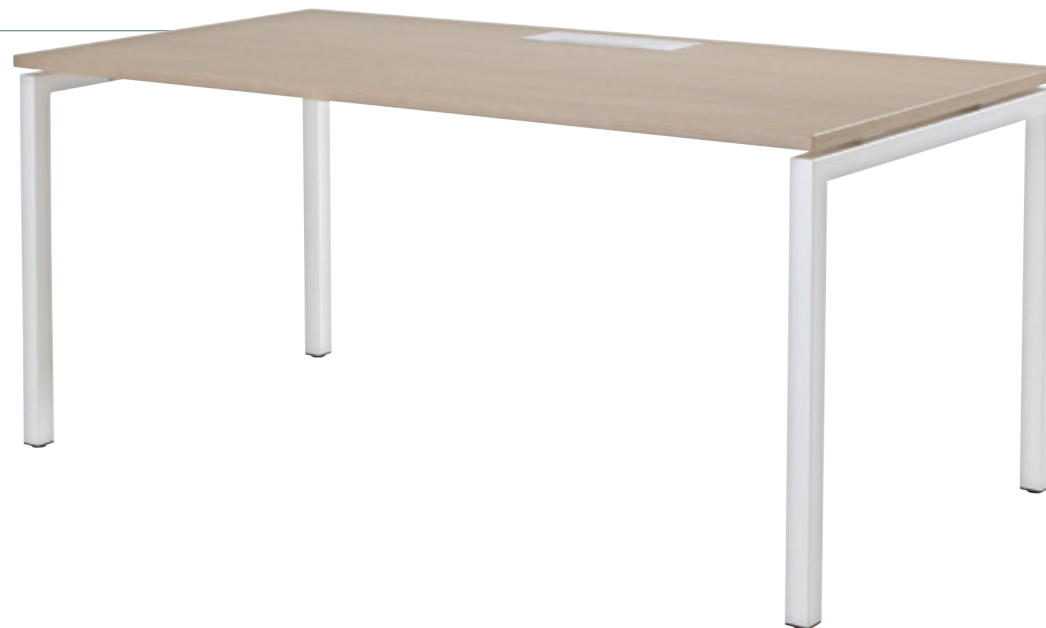
Bureau individuel droit