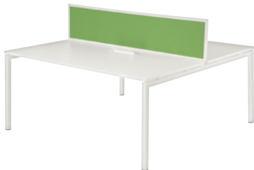
Pôle de 2 bureaux*

Negostock SHOWROOM CONSEIL WEB La solution mobilier d'entreprise