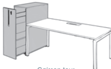
Caisson tour H109 x L40 x P80 cm