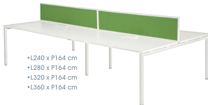
Pôle de 4 bureaux*