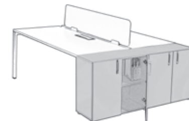
Armoire portes battantes H74 x L164 x P40 cm